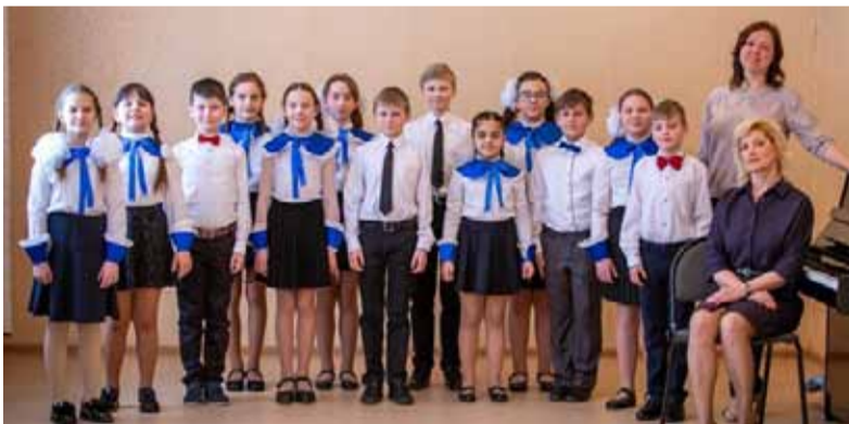
Вокальные ансамбли «Звёздочки», «Весёлые нотки», «Радуга» известны далеко за пределами Чернецкого.