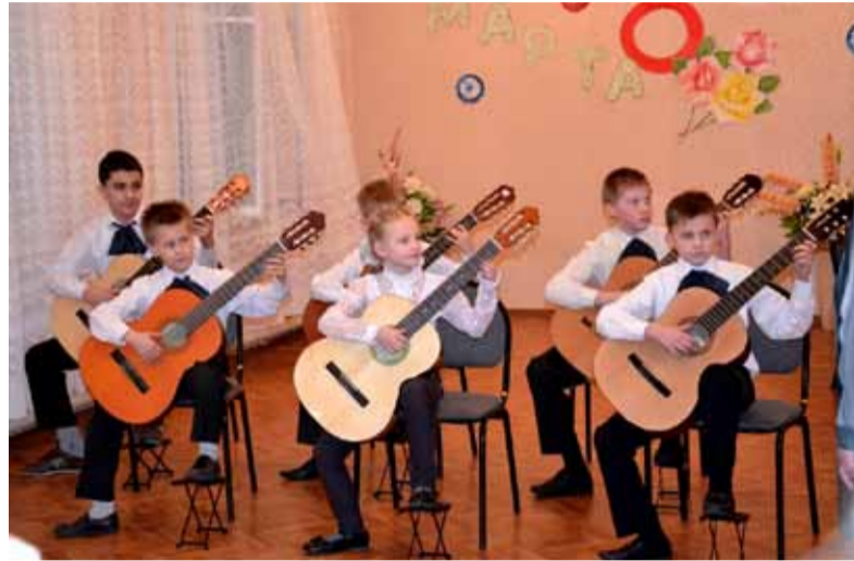
Ансамбль гитаристов «Солнечные струны».

Учащиеся художественного отделения проходят обучение по общеразвивающим программам «Декоративно-