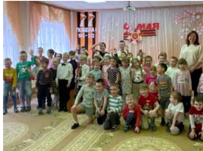
Ученики Чернецкого отделения Стремилковского филиала Чеховской детской школы искусств выступают не только на своей сцене, но и в детском саду «Белочка», Шараповском сельском доме культуры «Родник», на Дне города в Чехове, с военными соседней войсковой части.