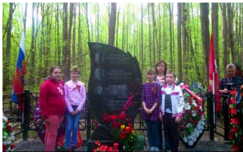
У памятника воинам, погибшим в годы Великой Отечественной войны.