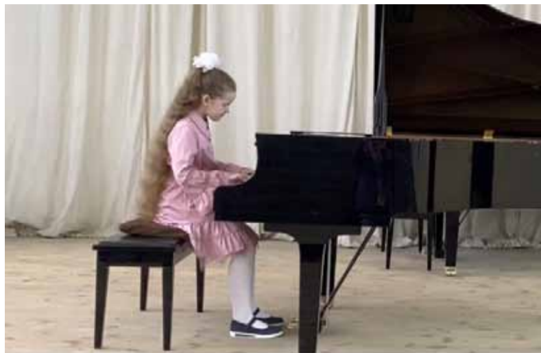
Дети с удовольствием исполняют классику на фортепиано.