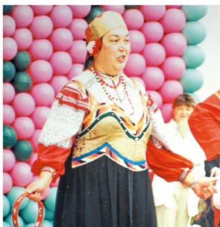
Выступление народных коллективов на Дне города.

Учителя пения обязаны были организовывать концерты художественной самодеятельности. Концерты проходили в сельском клубе по праздничным дням. Тамара хотела помочь матери и записалась в школьные артистки.