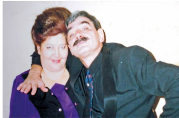
Народный артист России Александр Панкратов-Чёрный полюбил Тамару Ивановну с первого взгляда.

лонили весь зрительный зал. И мы не знали, куда посадить других зрителей. Программу показали по телевизору, мы впервые увидели себя по первому каналу.