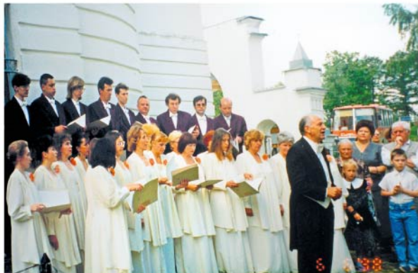
У стен Анно-Зачатьевского храма выступает Белорусский академический хор университета имени А.С. Пушкина.