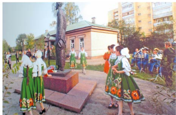
На открытии Музея писем А.П. Чехова.