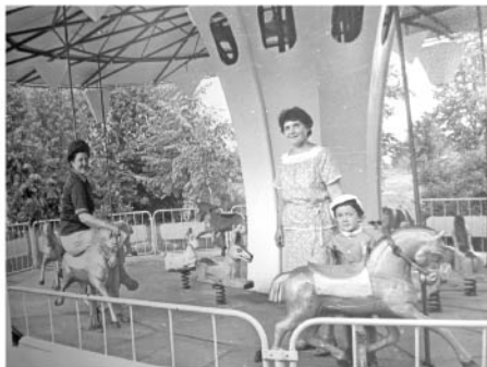
В парке культуры и отдыха. Фото начала 80-х годов.