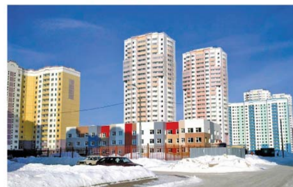
Микрорайон «Губернский» отличают чистота и порядок.

– От Су-155 Вам досталось хлопотное хозяйство. И всё же за годы Вашего управления в микрорайоне «Губернский» многое удалось