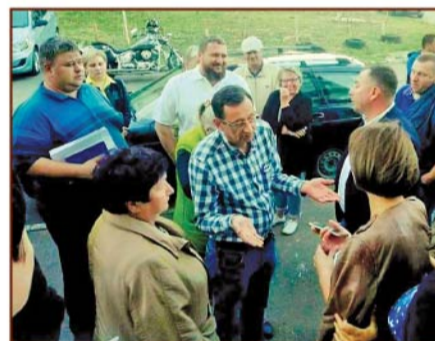
Встречи руководства УК «СтартСтрой+» с жителями помогают снять многие вопросы и достичь взаимопонимания.

Он собрал под своим крылом 80 предприятий – огромное производство, только на заработную плату которого уходило миллиард рублей в месяц. У него были свои кирпичные, лифтовые заводы. Созданный им в Серпухове уникальный испытательный центр лифтов с краш-тестом не имеет аналогов в России и в странах Европы. Всю сантехнику для построенных им домов выпускал Одинцовский калибровочный завод.